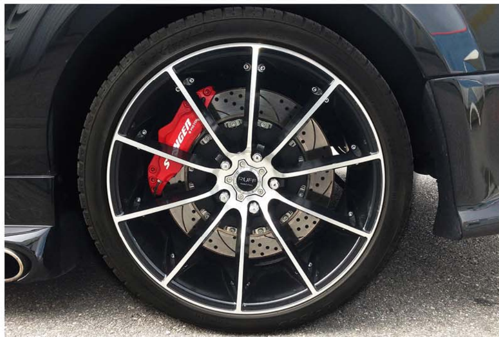
AR : 380MM - ÉTRIERES 6-PISTONS