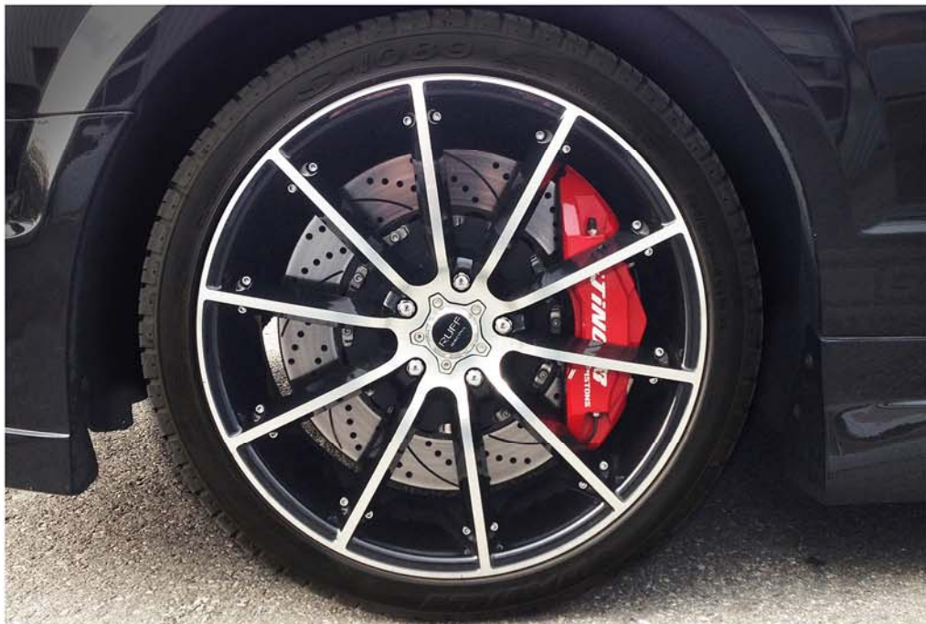
AV : 405MM - ÉTRIERES 8-PISTONS